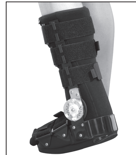
Ортез на голеностопный сустав HAS-301